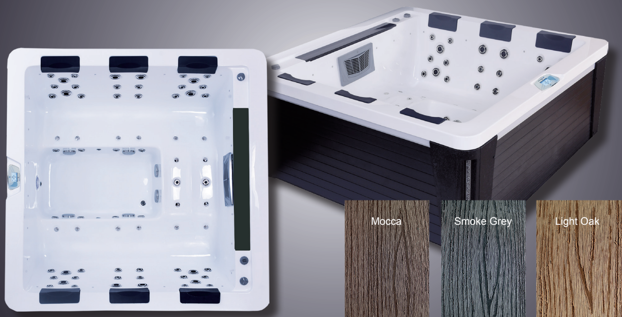
Wave Select Cabinet